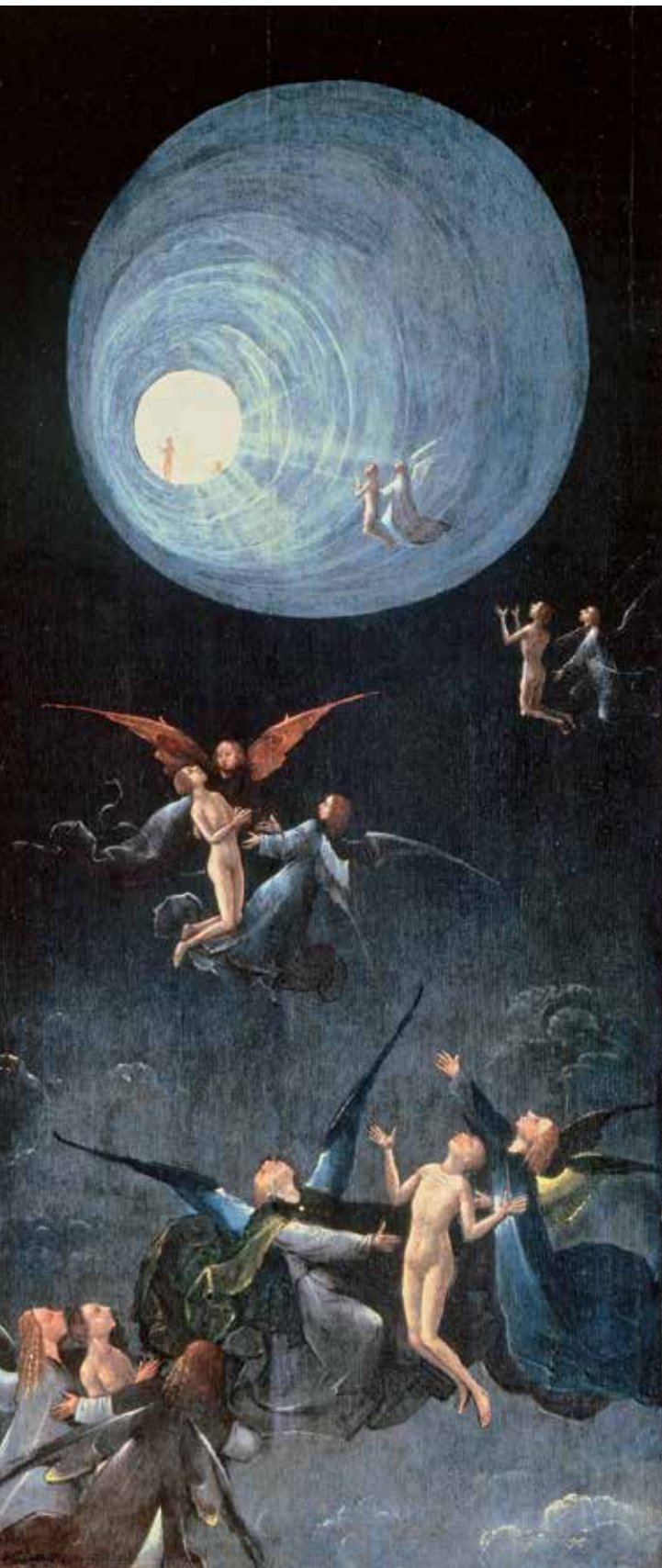
Der Aufstieg der Seligen , eine von vier Tafeln der Visionen des Jenseits des Hieronymus Bosch. 1505–1515, Gallerie dell'Accademia, Venedig.