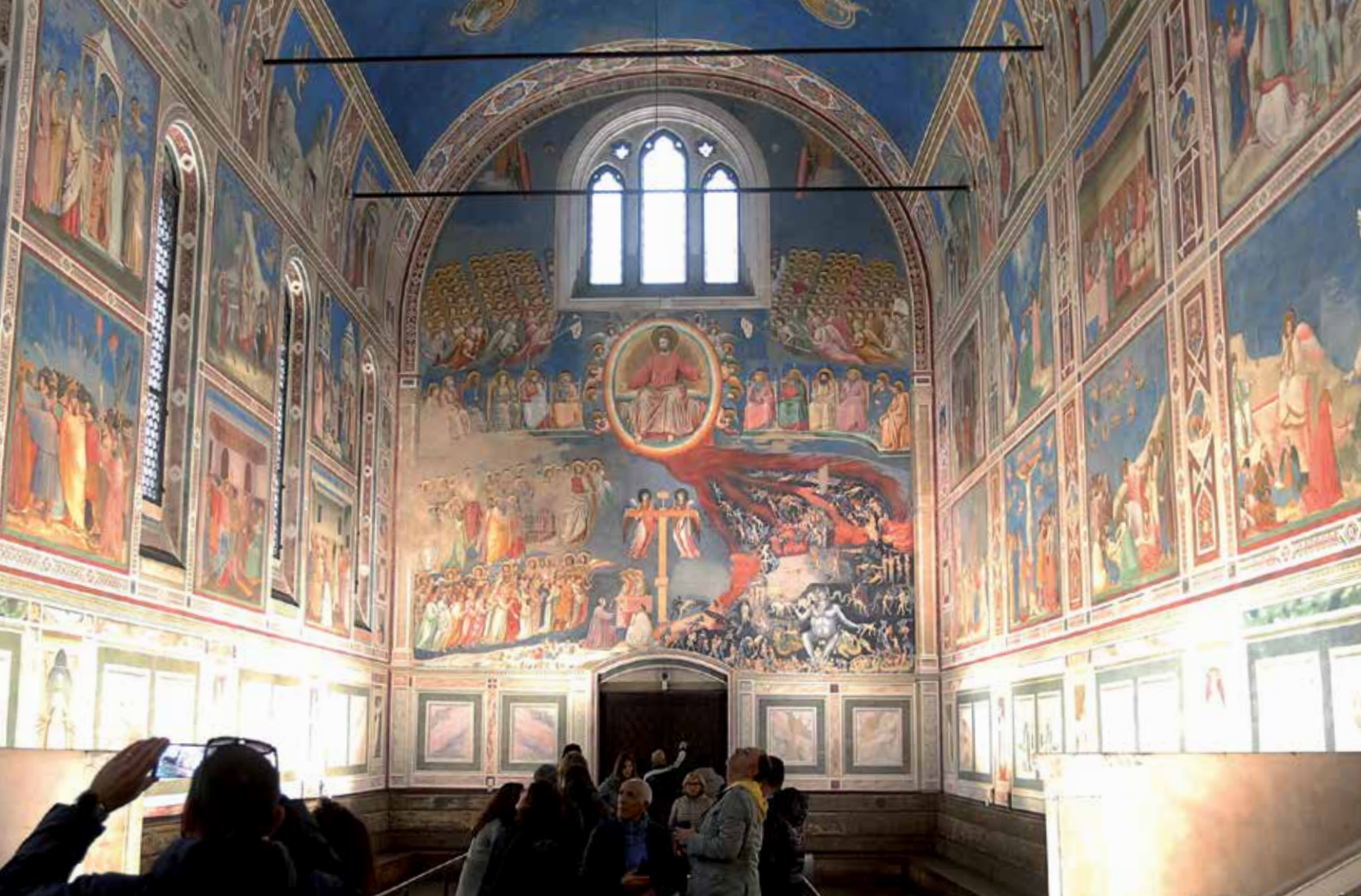
Das Jüngste Gericht von Giotto di Bondone (1306) über dem Eingangsportal der Scrovegni-Kapelle in Padua. Die Vorstellung eines Gerichts nach guten und bösen Taten war im frühen Judentum und in den frühen christlichen Gemeinden weit verbreitet. Im Christentum hat das Gericht eine bildreiche Wirkungsgeschichte entfaltet.

gerettet sind. So ist 1 Thess 1,10 überzeugt, dass Jesus „uns aus dem kommenden Zorngericht rettet“ (vgl. Röm 5,9). Andere Schriften drücken diese Zuversicht mit dem Bild aus, dass die Namen der zu Christus Gehörenden bereits im „Buch des Lebens“ verzeichnet sind (Phil 4,3; Lk 10,20; Offb 3,5; 20,12.15; 21,27). Paulus deutet das Heilsgeschehen in Christus als „Versöhnung“ mit Gott, was bedeutet, dass Feindschaft und Trennung, die bislang die Beziehung zu Gott bestimmten, von Gott bereits überwunden wurden (2 Kor 5,18-20; Röm 5,10f; 11,15).