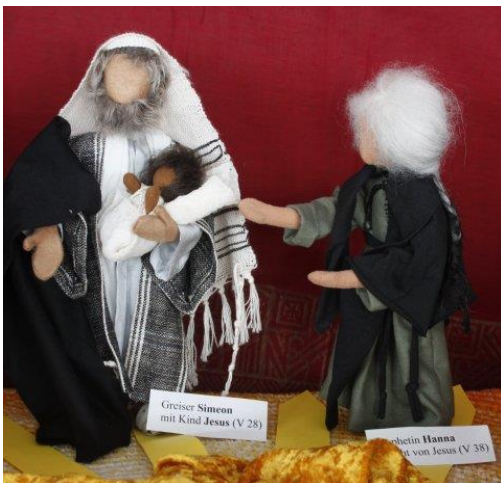
Tisch 3: Nunc dimittis, Simeon (Detail)