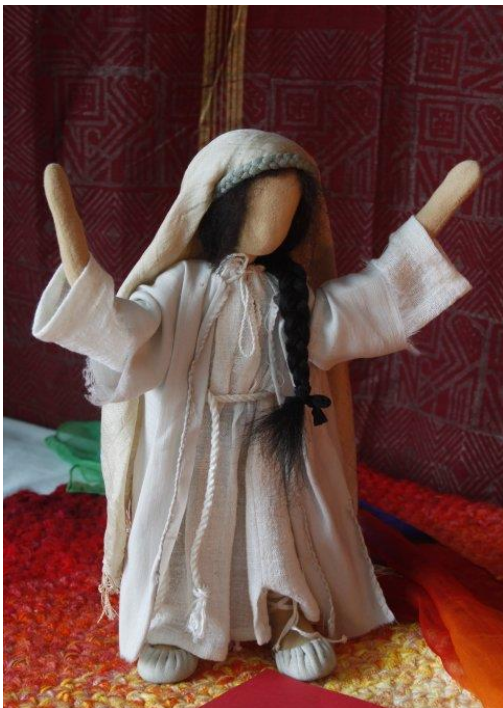
Tisch 1: Magnificat, Maria (Detail)