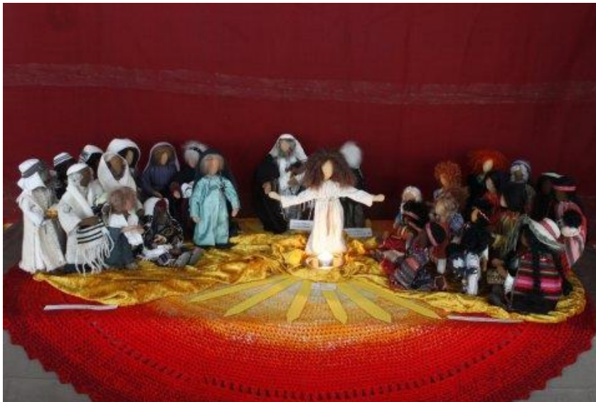
Tisch 3: Nunc dimittis Juden und alle Welt

Weitere Darstellungen – die teilweise auch im Materialpool eingestellt sind - waren z.B. bisher: Der Stammbaum Jesu nach Matthäus (siehe Advents- und Weihnachtskrippe 2011), das älteste Weihnachtsevangelium nach Paulus (Gal 4), Die Kindheitsgeschichten nach dem Matthäus- und dem Lukasevangelium, die Geburtserzählung Lk 2 in drei Szenen, der Johannesprolog (Joh 1), die Verheißungen Jes 7; 9; 11, „Adventliche Gestalten“ (siehe Advents- und Weihnachtskrippe 2010). Wie Sie im Advent zu diesem Thema die Bibel lesen können, finden Sie als Anregung hier .