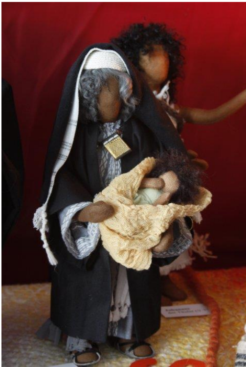
Tisch 2: Benedictus, Zacharias (Detail)