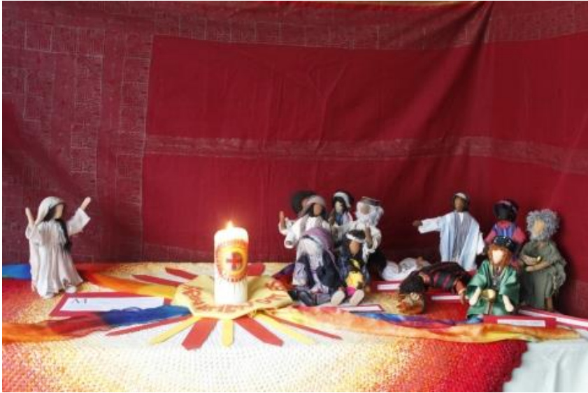
Tisch 1: Magnificat