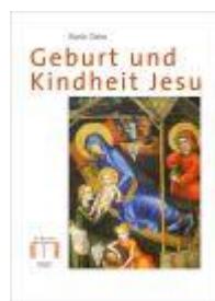
Geburt und Kindheit Jesu