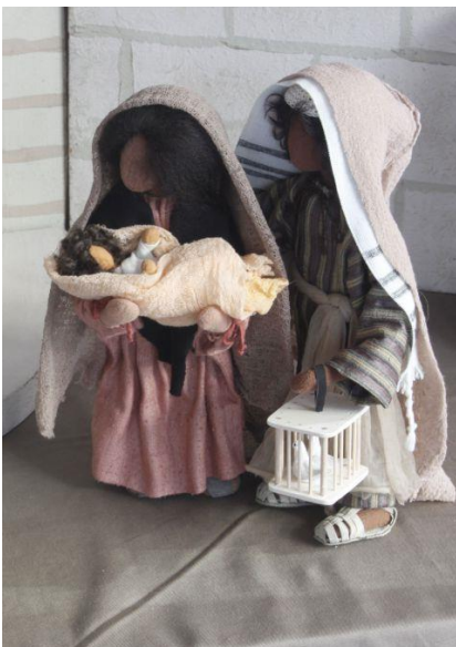
Tisch 3: Josef und Maria mit dem Kind (Detail)