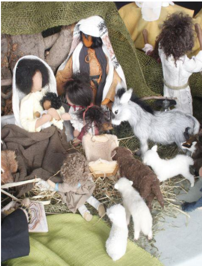
Tisch 2: Geburt, Maria und Josef (Detail)