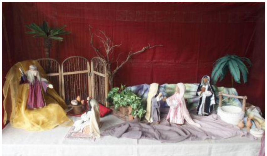
Tisch 1: Verkündigung und Besuch Marias bei Elisabet