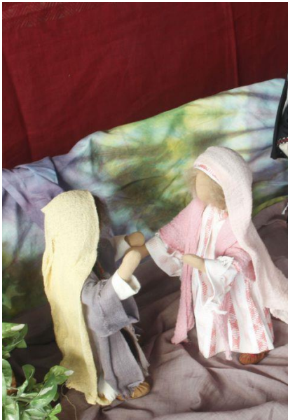
Tisch 1: Besuch Marias bei Elisabet (Detail)

[Eine theologische Einführung] [Bibeltexte nach Lukas] [Beschriftung Tische 1-3]