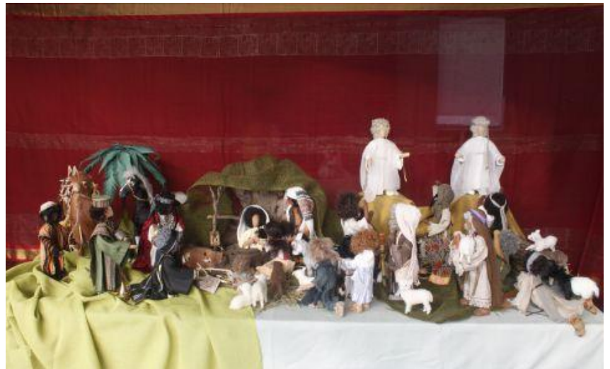
Tisch 2: Geburt Jesu Beschriftung