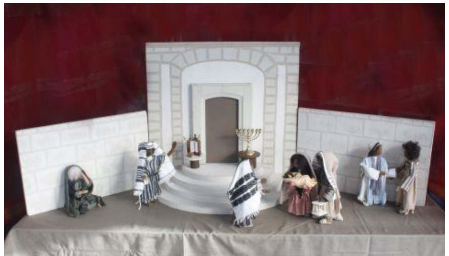
Tisch 3: Darstellung im Tempel Beschriftung