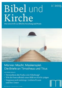
Bibel und Kirche 2/2023